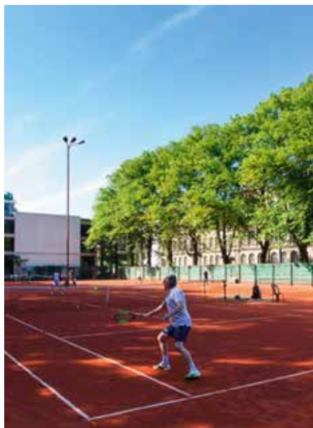
Tennisanlægget i centrum af Riga