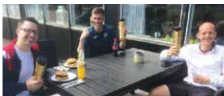
DAI-mestrene fejre deres nyvundne boldrør med den klassiske Flæskestegs-sandwich

tico i Italien. Det er kun tennis, da World Sport Games kun afholdes hvert andet år. Vi håber at stille med et eller flere seniorhold og et eller flere veteranhold.