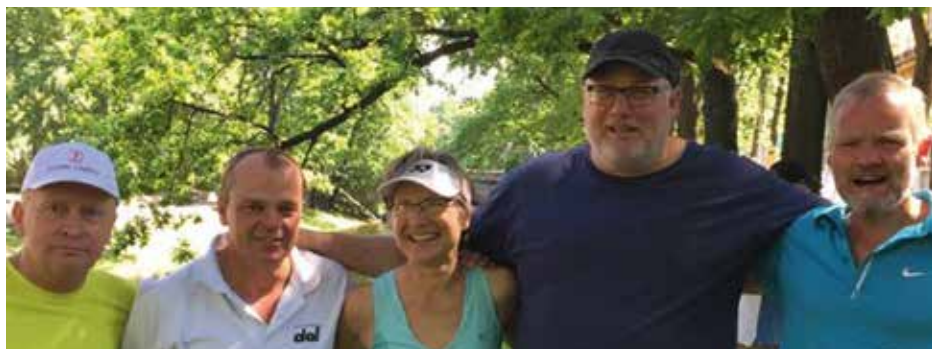
DAI-deltagere i Riga