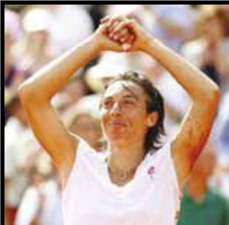
Den italienske tennisspiller, som vandt French Open 2010, hedder Francesca ...?